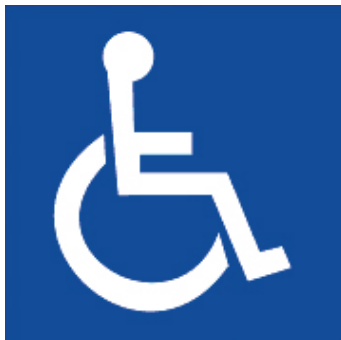
Medzinárodný symbol prístupnosti